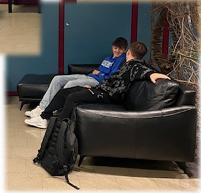
Chill- und Lernzonen