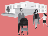
Kinder- und Familientreff Bifang

Diese Broschüre wurde von den Familientreffpunkten Rankweil und dem Verein Eltern-Kind-Treff Rankweil und Brederis in Zusammenarbeit mit der Marktgemeinde Rankweil erstellt.